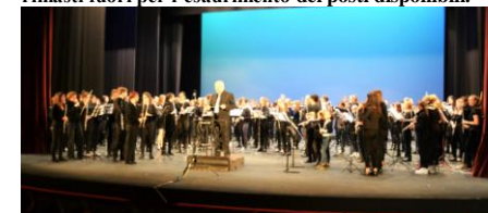
La "Trieste Flute Big Orchestra"

Il risultato premia l'impegno, è proprio il caso di sottolinearlo a proposito dell'organizzazione del "V° Trieste Flute Day", che si è svolto, con il massimo successo ed un pubblico entusiasta, domenica 29 novembre alla Sala "Tripovich" di Trieste. Senz'altro la più grande impresa voluta con determinazione e portata a termine dalla "Trieste Flute Association", con un risultato dove le cifre parlano da sole: circa centosettanta flautisti di ogni età hanno suonato sull'ampio palcoscenico della Sala, davanti a quasi un migliaio di spettatori entusiasti, per non contare quelli rimasti fuori per l'esaurimento dei posti disponibili.