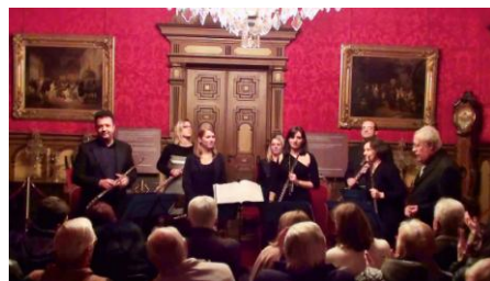
Il "Trieste Flute" Ensemble a Miramare