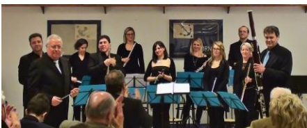
Il fagottista Sergio Lazzeri con il "Trieste Flute"

Nel mese di ottobre il "Trieste Flute" Ensemble aveva suonato al Circolo Canottieri "Saturnia" di Barcola per collaborare alla raccolta dei fondi necessari al viaggio in Perù di un equipaggio della Società che vi si recava per i Campionati Mondiali. Quell'equipaggio è arrivato terzo, per cui si può ben dire che "Trieste Flute"... porta fortuna. Il 20 dicembre l'Ensemble è stato invitato nuovamente al Circolo per festeggiare l'evento e nell'occasione ha presentato un programma, in parte nuovo, costituito dal Canone di Pachelbel, l'Overture dal "Flauto Magico" di Mozart, l'American Duet di Doppler, "Colibri" di Magalif (solista Irina Perosa), "Mission" e "Triello" di Morricone, "Polka" di Fuchik e "Galway Fantasy". Solista d'eccezione in Morricone e Fuchik è stato il famoso fagottista Sergio Lazzeri (nella "Polka" al controfagotto), che ha suscitato l'entusiasmo del folto pubblico.